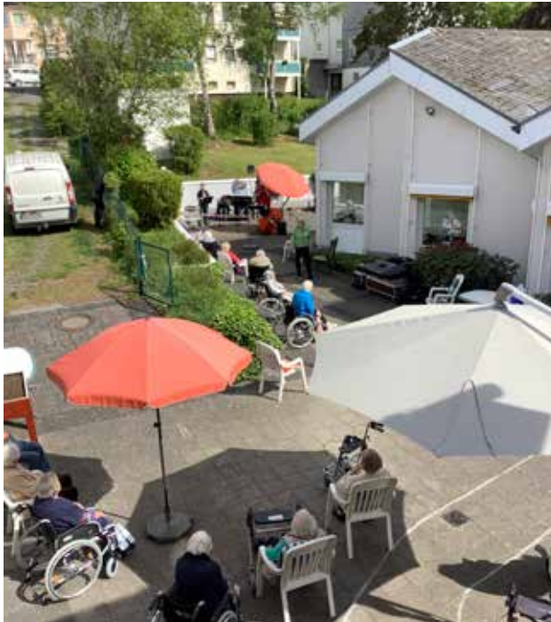
Den Sommer genießen unsere Bewohner gerne im Freien – auf der Terrasse oder im Sonnenhof.

Das Fliedner-Heim zeichnet sich durch seine familiäre Atmosphäre aus. Das Haus besteht aus gemütlichen, kleinen Wohngruppen mit Aufenthaltsräumen in denen gemeinsam gegessen wird und individuelle Gruppenangebote stattfinden. Behagliche Sitzcken, der Sonnenhof und die Gartenterrasse laden zum Verweilen und Plaudern ein.