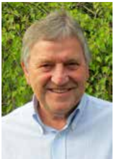
Werner Weller Beratung Hausnotruf

Ein Anruf genügt. Wir vereinbaren gerne einen persönlichen Beratungstermin mit Ihnen. Wenn Sie möchten, kommen wir dazu auch zu Ihnen nach Hause.